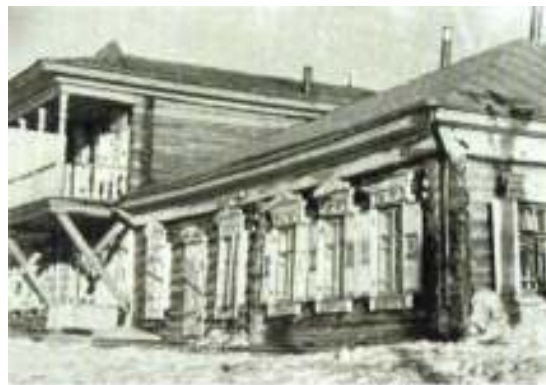
Дом священнослужителей. С фотографии 1930 года.

В 1913 году норвежец Фрицьоф Нансен, совершавший путешествие по Енисею в Сибирь, назвал Дудинку «се-