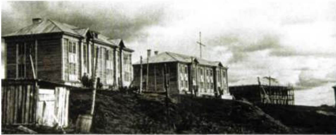
Начало строительства улицы Советской (лето 1941 года)