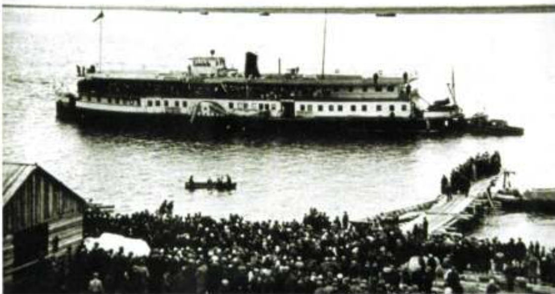
Приход каждого парохода в Дудинку - событие. 1945 г.

как сама «златокипящая Мангазея», другим же, напротив, была суждена долгая жизнь. Оказывается, в XVII - первой половине XIX веков «зимовье Дудинское» или «зимовье Дудино ясачно» располагалось не на берегу Енисея, а на реке Дудине - выше по течению и к востоку от Енисея. На карте же Харитона Лаптева (1743 г.) оно указано на северной стороне устья «реки Дудиной». В Дудинском зимовье в XVIII веке неоднократно останавливались участники Великой Северной экспедиции: и Харитон Лаптев, и Семен Челюскин, и Федор Минин -