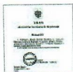
Законодательство о бесплатной юридической помощи

Также не оказывается бесплатная юридическая помощь гражданину, если прокурор в соответствии с федеральным законом уже обратился в суд с заявлением в защиту прав, свобод и законных интересов этого гражданина.