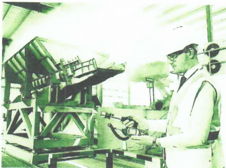
Расходы на проведение специальной оценки условий труда стали больше в 8,7 раза

Согласно проведенному анализу, на выбранных предприятиях за 7 лет активнее всего выросли траты на по-