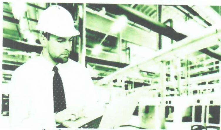
Каждый пятый профвизит проведен по запросу бизнеса

ПРОФВИЗИТ ИНСПЕКЦИИ ТРУДА МОЖНО ЗАКАЗАТЬ ОНЛАЙН