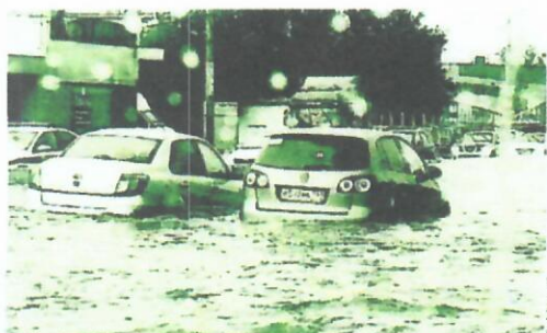
Сильный ливень может привести к опозданию

Из пояснительной записки к документу следует, что в настоящее время к работникам нередко применяются дисциплинарные взыскания из-за опоздания вследствие тяжелых погодных условий. По моральным соображениям такие обстоятельства являются уважительной причиной, однако в законодательстве это никак не отражено и вызывает между работниками и работодателями разногласия, которые нередко перетекают в судебные споры, отмечают специалисты ГИТ в Республике Ингушетия. Например, Второй КСОЮ в определении от 22.09.2022 № 88-20831/2022 пришел к выводу, что работодатель не может уволить сотрудника, который опоздал на работу из-за обильного снегопада, вызвавшего ухудшение транспортной ситуации. Суд подтвердил уважительность отсутствия работника и незаконность увольнения за прогул по причине плохих погодных условий.