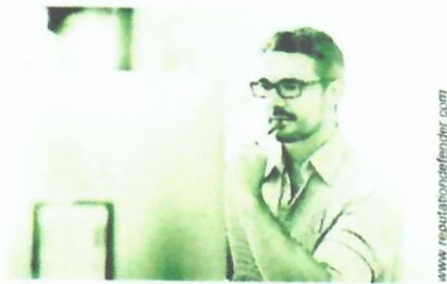
Тестирование нужно проходить раз в три года