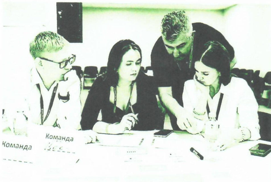
Игры по безопасности – шаг к нулевому травматизму

ОБУЧЕНИЕ ПО ОХРАНЕ ТРУДА МОЖЕТ БЫТЬ УВЛЕКАТЕЛЬНЫМ